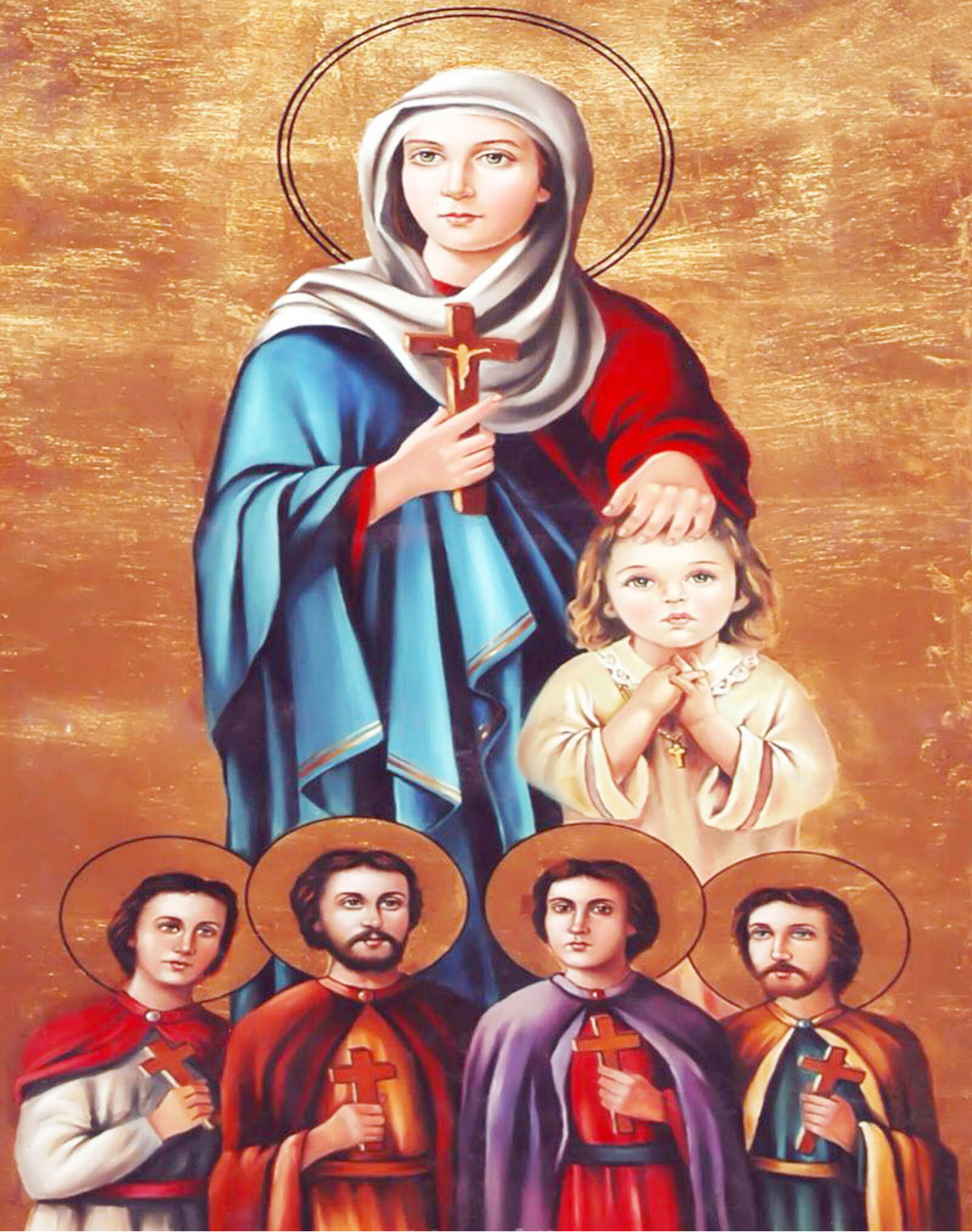
القديسة رفقة وأولادها الخمسة